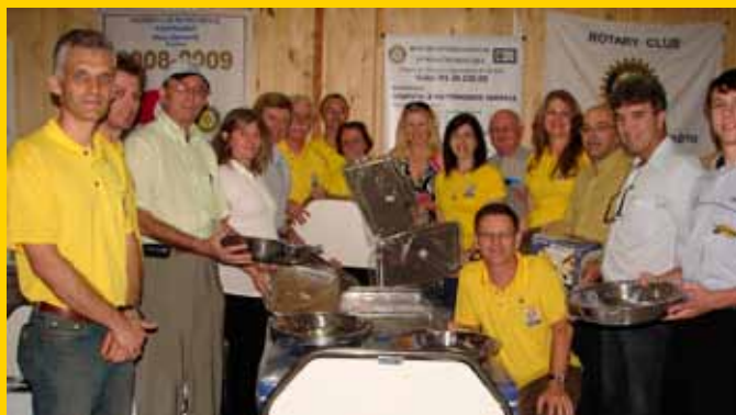
Equipamentos foram adquiridos para o Hospital Samária de Rio do Sul