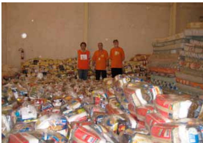
Cestas básicas montadas em Joinville atendiam desabrigados de Santa Catarina.

A atuação do Rotary aconteceu em todas as cidades invadidas pelas águas e atingidas pelos deslizamentos. Em Blumenau e Joinville, companheiros tomaram a iniciativa de coordenar as centrais de arrecadação de donativos, que começaram a chegar de todas as regiões do país. Os rotarianos se juntaram às centenas e até milhares de pessoas que dispuseram dias seguidos à separação dos donativos para o rápido envio aos desabrigados.