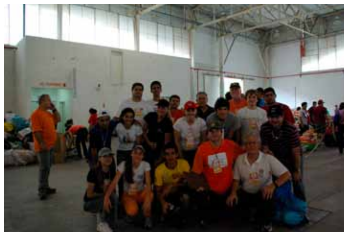
Rotarianos, rotaractianos e intercambistas atuaram no centro de distribuição de Joinville

A tragédia comprovou o poder de mobilização do Rotary e, principalmente, a solidariedade dos companheiros. Dezenas de rotarianos das cidades atingidas imediatamente passaram a socorrer as vítimas e a atender os desabrigados. Paralelamente, contatos com os demais distritos brasileiros começaram a resultar em ações concretas de ajuda. Rotarianos também atingidos pelas enchentes ou pelos deslizamentos eram socorridos por companheiros de seus clubes ou cidades vizinhas.