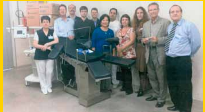
Hospital São José de Jaraguá do Sul recebeu investimentos de R$ 134 mil