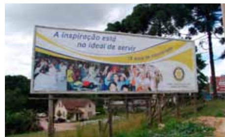
Outdoors comemorativos ajudaram a divulgar os projetos realizados pelo clube