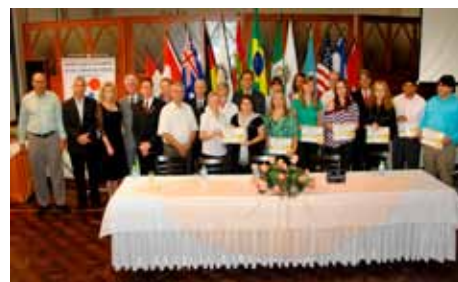
Cidadãos e instituições parceiras receberam o título de Amigos do Rotary

Para comemorar seus 15 anos de fundação, o Rotary Club de São Bento do Sul - Cidade dos Móveis realizou uma reunião festiva para homenagear 15 cidadãos ou instituições parceiras. O evento aconteceu dia 23 de março, reunindo o casal governador, autoridades públicas, convidados, imprensa e rotarianos de diversos clubes da região. Com a homenagem, o clube tinha como objetivo reconhecer o trabalho voluntário de pessoas ou instituições que ajudaram a concretizar os projetos do clube em toda a sua história.