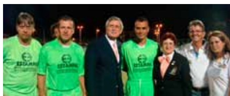
Amigos do Dunga e Combinado Catarinense colaboraram com a campanha

Centenas de famílias atingidas pelas enchentes serão beneficiadas com os recursos obtidos pelo futebol beneficente envolvendo os Amigos de Dunga e o Combinado Catarinense. Promovido pelo RC Hermann Blumenau e realizado dia 20 de março no Estádio do Sesi, o evento arrecadou R$ 21.560,00 através das 1.814 pessoas que pagaram ingressos. Uma comissão do clube foi montada e vai fazer uma análise criteriosa do cadastro de pessoas atingidas, em conjunto com a Prefeitura, para atender as famílias com a aquisição de eletrodomésticos.