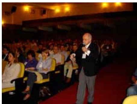
Governador eleito Ernoe Eger esclareceu as metas da gestão 2009/10

Os líderes dos clubes da gestão 2009/10 participaram, dia 25 de abril em Indaial, da Assembleia Distrital do Distrito 4650. Presidentes e membros das comissões internas receberam treinamento sobre a gestão de seus clubes e informações sobre o Rotary para dar base às suas atividades e à forma de conduzir a organização. O governador eleito Ernoe Eger mostrou as metas do Rotary International e do Distrito 4650, além de motivar os rotarianos para que todos trabalhem integrados na próxima gestão.